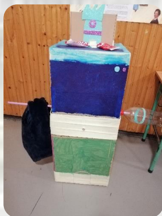
Ondreász Nóri és Tóth Ilona 3.a osztályos tanulók

Két délutánon át készítettük kartondobozokból, kosárpalánkból, focikapuból. Többször összevesztünk, de a végén elkészült a 1,5 méteres újrhasználító, ruhaszárító és sportoló robotunk.